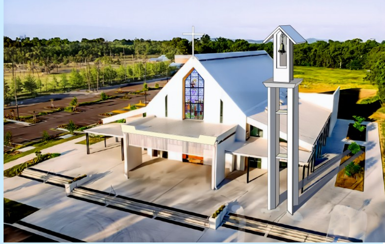
NHÀ THỜ NỮ VƯƠNG CÁC THÁNH TỬ ĐẠO VN 54 Flint St INALA 4077

CHÚA NHẬT II PHỤC SINH - NĂM C 27/04/2025